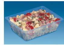
BARQUETTE CAISSIPACK TRANSPARENT E 1000G