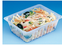
BARQUETTE CAISSIPACK TRANSPARENTTE 750G