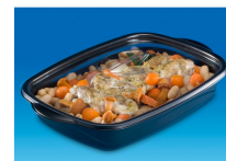
BOITE ALIMENTAIRE MARMIPACK 1000ML NOIR + COUVERCLE