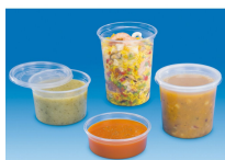
POT À SAUCE 96ML TRANSPARENT