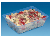
BARQUETTE CAISSIPACK TRANSPARENT E 1500G