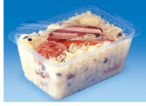
BARQUETTE ALPHACEL THERMOSCELLABL E 1000ML

Catalogue PDF interactif, cliquez sur l'image pour accéder à la page web.