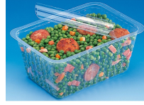
BARQUETTE ALPHACEL THERMOSCELLABL E 2000ML