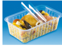
BARQUETTE ALPHACEL THERMOSCELLABL E 375ML