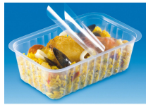
BARQUETTE ALPHACEL THERMOSCELLABL E 375ML