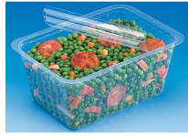
BARQUETTE ALPHACEL THERMOSCELLABL E 1500ML