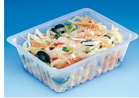
BARQUETTE CAISSIPACK TRANSPARENTTE 750G