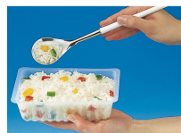
BARQUETTE CAISSIPACK TRANSPARENT E 250G