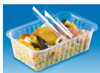
BARQUETTE ALPHACEL THERMOSCELLABL E 375ML