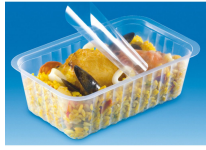
BARQUETTE ALPHACEL THERMOSCELLABL E 375ML