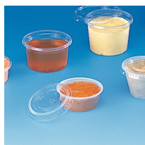
POT À SAUCE 30ML OPAQUE