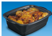
BOITE ALIMENTAIRE MARMIPACK 1800ML NOIR + COUVERCLE