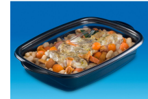
BOITE ALIMENTAIRE MARMIPACK 1000ML NOIR + COUVERCLE