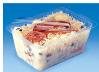
BARQUETTE ALPHACEL THERMOSCELLABL E 1000ML

Catalogue PDF interactif, cliquez sur l'image pour accéder à la page web.