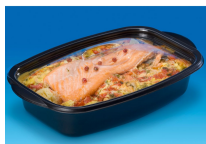
BOITE ALIMENTAIRE MARMIPACK 1500ML NOIR + COUVERCLE