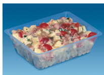
BARQUETTE CAISSIPACK TRANSPARENT E 1500G