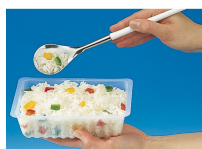
BARQUETTE CAISSIPACK TRANSPARENT E 250G