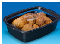
BOITE ALIMENTAIRE MARMIPACK 500ML NOIR + COUVERCLE