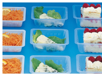
BARQUETTE CAISSIPACK TRANSPARENT E 125G