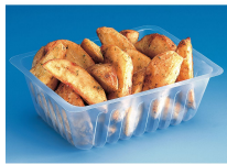
BARQUETTE CAISSIPACK TRANSPARENT E 500G