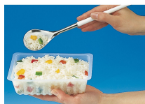
BARQUETTE CAISSIPACK TRANSPARENT E 250G