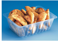
BARQUETTE CAISSIPACK TRANSPARENTTE 500G