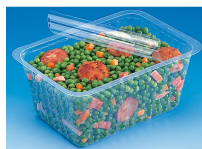
BARQUETTE ALPHACEL THERMOSCELLABL E 2000ML