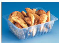
BARQUETTE CAISSIPACK TRANSPARENT E 500G