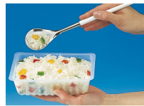
BARQUETTE CAISSIPACK TRANSPARENT E 250G