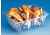
BARQUETTE CAISSIPACK TRANSPARENTTE 500G