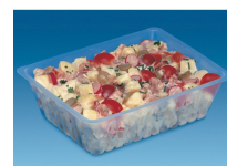
BARQUETTE CAISSIPACK TRANSPARENT E 1000G