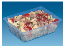
BARQUETTE CAISSIPACK TRANSPARENT E 1500G