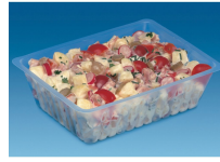
BARQUETTE CAISSIPACK TRANSPARENT E 1000G