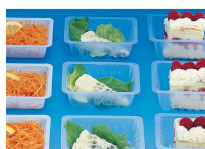
BARQUETTE CAISSIPACK TRANSPARENT E 125G