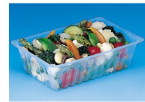
BARQUETTE CAISSIPACK TRANSPARENT E 375G