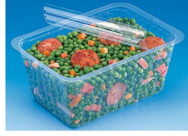
BARQUETTE ALPHACEL THERMOSCELLABL E 1500ML