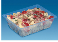
BARQUETTE CAISSIPACK TRANSPARENTTE 1000G

Catalogue PDF interactif, cliquez sur l'image pour accéder à la page web.