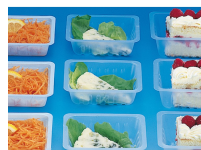
BARQUETTE CAISSIPACK TRANSPARENT E 125G