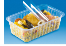
BARQUETTE ALPHACEL THERMOSCELLABL E 375ML