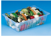
BARQUETTE CAISSIPACK TRANSPARENTTE 375G