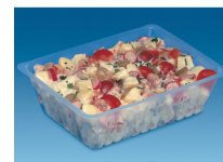
BARQUETTE CAISSIPACK TRANSPARENT E 1500G