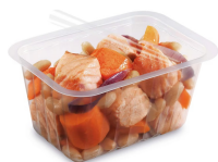
BARQUETTE ALPHACEL THERMOSCELLABL E 500ML