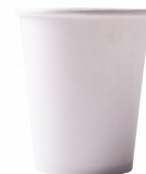
GOBELET CARTON BLANC - 20 CL