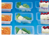
BARQUETTE CAISSIPACK TRANSPARENTTE 125G