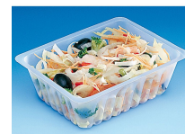
BARQUETTE CAISSIPACK TRANSPARENT E 750G