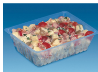
BARQUETTE CAISSIPACK TRANSPARENTTE 1500G