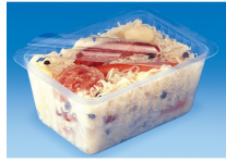
BARQUETTE ALPHACEL THERMOSCELLABL E 1000ML

Catalogue PDF interactif, cliquez sur l'image pour accéder à la page web.