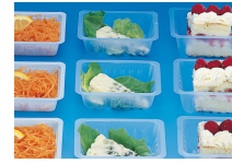
BARQUETTE CAISSIPACK TRANSPARENT E 125G