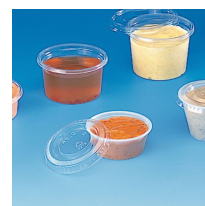
COUVERCLE TRANSPARENT POUR POT SAUCE 30ML