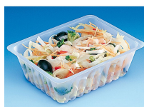
BARQUETTE CAISSIPACK TRANSPARENTTE 750G