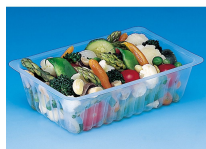
BARQUETTE CAISSIPACK TRANSPARENT E 375G