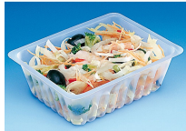
BARQUETTE CAISSIPACK TRANSPARENTTE 750G