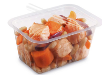
BARQUETTE ALPHACEL THERMOSCELLABL E 500ML