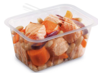
BARQUETTE ALPHACEL THERMOSCELLABL E 500ML