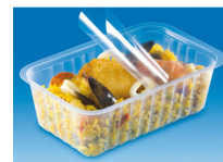
BARQUETTE ALPHACEL THERMOSCELLABL E 250ML