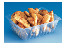
BARQUETTE CAISSIPACK TRANSPARENT E 500G