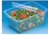
BARQUETTE ALPHACEL THERMOSCELLABL E 2000ML