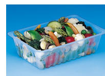
BARQUETTE CAISSIPACK TRANSPARENT E 375G