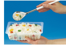
BARQUETTE CAISSIPACK TRANSPARENT E 250G