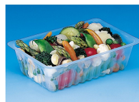
BARQUETTE CAISSIPACK TRANSPARENT E 375G