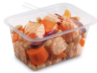
BARQUETTE ALPHACEL THERMOSCELLABL E 500ML