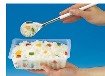
BARQUETTE CAISSIPACK TRANSPARENTTE 250G