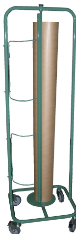
APPAREIL DÉROULEUR VERTICAL 1200 MM