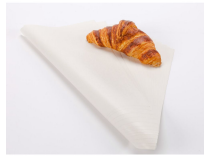
PAPIER CORDE BLANC - 550 X 720 MM