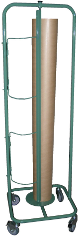
APPAREIL DÉROULEUR VERTICAL 1200 MM

Catalogue PDF interactif, cliquez sur l'image pour accéder à la page web.