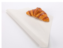
PAPIER CORDE BLANC - 550 X 720 MM